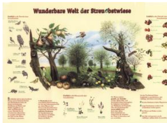
Beispiel Schautafel „Wunderbare Welt der Streuobstwiese“