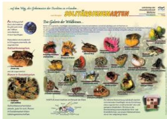
Beispiel Schautafel „Solitärbienenarten“

Vor Ort zu sehen sind auf dem Lehrbiotop der Lebensraum Streuobstwiese, rund 20 verschiedene Nisthilfen für Vögel, Fledermäuse und Insekten, Benjeshecke, Steinhauften, Honigbienenstand, Wildbienenstation, Wildblumenwiese, verschiedene Baum- und Straucharten uvm.