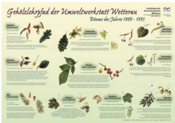
Schautafel 1: Bäume des Jahres 1989 - 1995

Im Oktober 1999 wurde anlässlich des zehnjährigen Jubiläums der Umweltwerkstatt Wetterau auf der rekultivierten Müllkippe in Assenheim der Gehölzlehrpfad angelegt. Unterstützt durch eine Reihe von Paten wurden die Bäume des Jahres seit dem Gründungsjahr 1989 gepflanzt. Mittlerweile finden sich hier über 20 verschiedene Baumarten, die mit Namensschildern ausgestattet sind. Zwei große Übersichtstafeln informieren über die Biologie der einzelnen Baumarten: