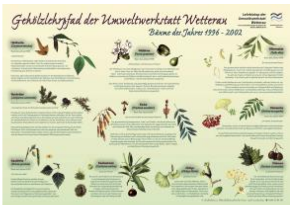
Schautafel 2: Bäume des Jahres 1996 - 2002

Auf dem benachbarten Lehrbiotop befinden sich neben einer Reihe interessanter Stationen fünf weitere Schautafeln mit Erläuterungen zur den Biotoptypen und Tierarten: „Wunderbare Welt der Streuobstwiese“, „Einheimische Fledermäuse“, „Solitärbienenarten“, „Benjeshecke“ und „Leben im Steinhauften“.